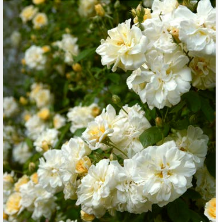
Rosa Malvern Hills -R- Rambler

Blüte: gelb, halbgefüllt, Juni - Oktober