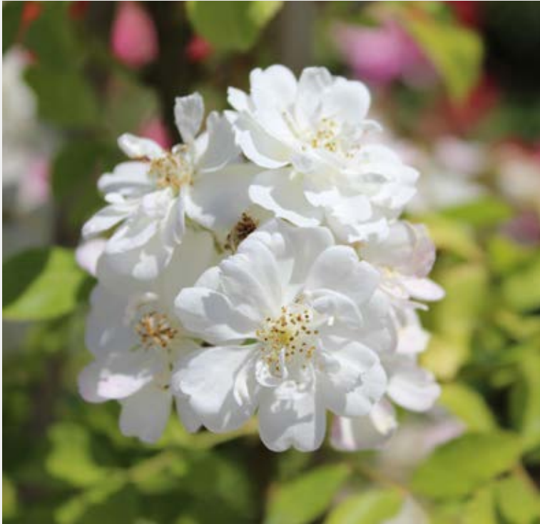
Rosa Guirlande d'Amour -R- (ADR 2012)

Rambler sind Kletterkünstler und besitzen vitale Wüchsigkeit. Die feinen elastischen Triebe sind mit großen Blütendolden besetzt, die stark duften. Ramblerrosen haben eine wunderschöne Herbstlaubfärbung und üppigen Hagebuttenschmuck.